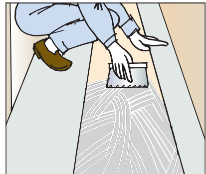
●マンション等、半屋外のノンスリップシートの施工に