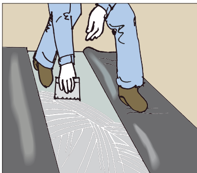
●塩ビ床シートの施工に