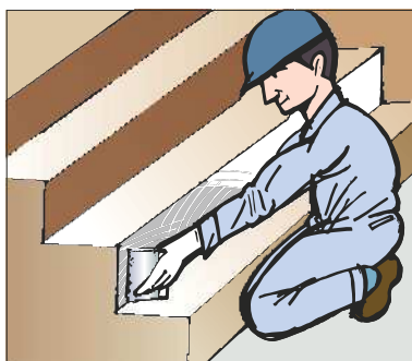
●階段の立ち上げ、ササラ巾木の施工