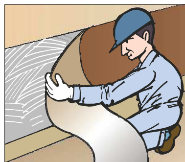
●塩ビタイル・シートの腰壁への施工