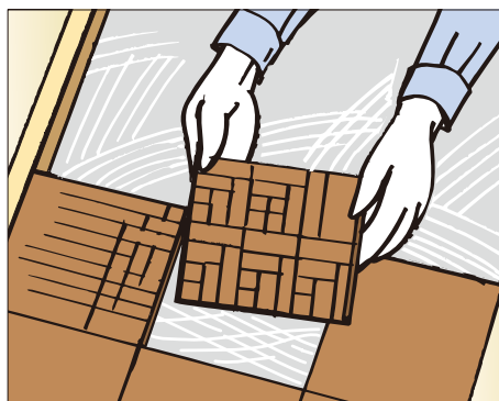
●パーケット等の施工に