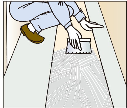
●マンション等、半屋外のノンスリップシートの施工に