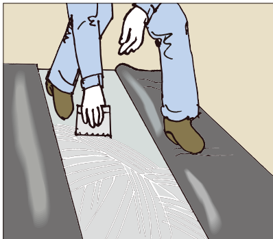
●塩ビ床シートの施工に