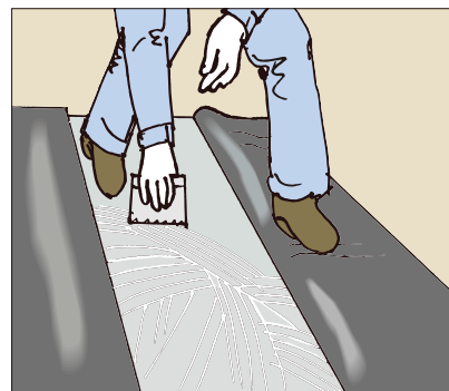
●ビニル床シートの施工に