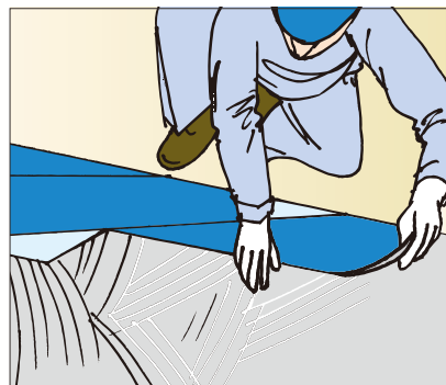
●ビニル床タイルの施工に