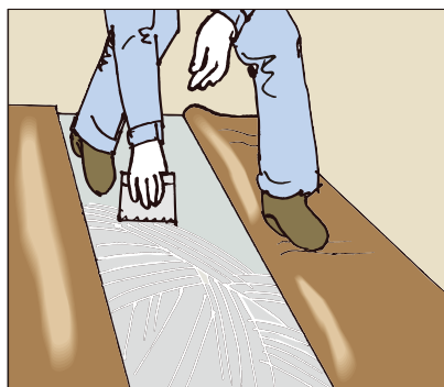
●ゴム系シートの施工に