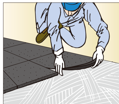
●ゴムチップ床材の施工に